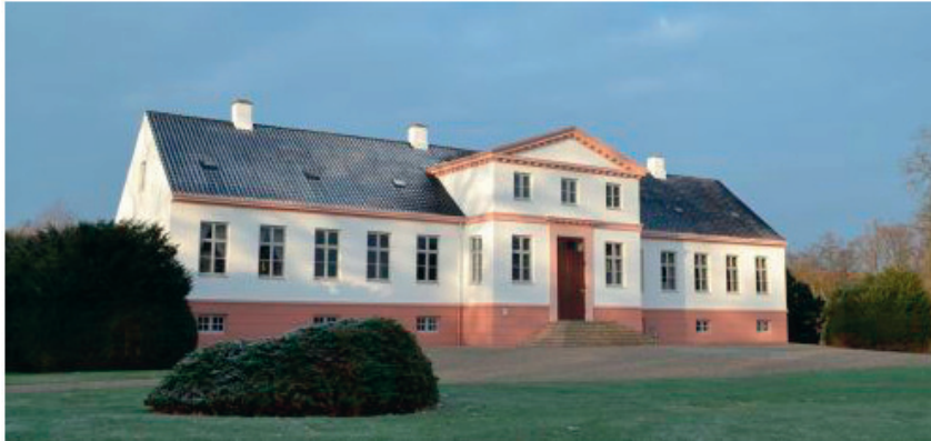
Pederstrup (numera Reventlowmuseum)